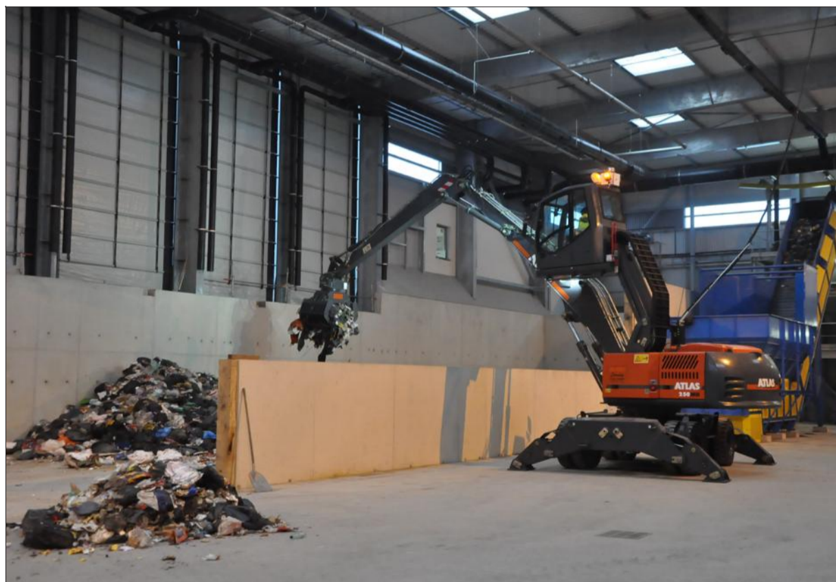
Les déchets ont commencé à arriver cette semaine à Ecocea, l'usine de traitement du Smet 71.