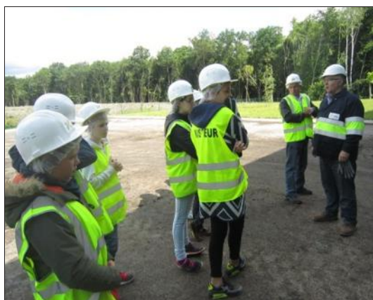
■ La visite a fait réfléchir les élèves.

Après le concours sur la lutte contre le gaspillage alimentaire en restauration collective réalisé avec le Siced (Syndicat intercommunal de collecte et d'élimination des déchets de la Bresse du nord), les collèges de Pierre-de-Bresse et Saint-Germain-du-Plain ont remporté une visite au centre de traitement des ordures ménagères, Ecocea, basé à Chagny. Les élèves ont découvert les étapes de traitement des ordures ménagères. La visite s'est terminée par la découverte de l'enfouissement des déchets sous terre (centre de stockage des déchets) qui a amené les élèves à se poser des questions sur le devenir de notre planète.