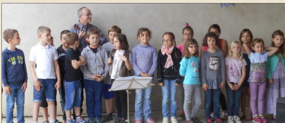
■ Les élèves de CE1 pendant le spectacle.