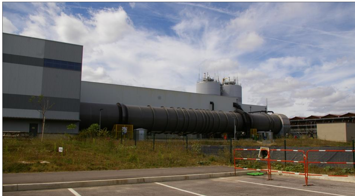
■ L'usine, qui a terminé sa période d'essai, valorise la moitié des ordures ménagères qu'elle reçoit en produisant du gaz et du compost.

La coopérative va acheter 30 000 tonnes de compost normé